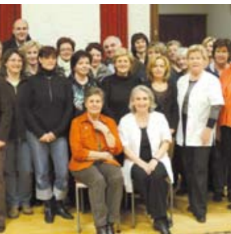
Blutabnahmeaktion des Vereins „Geben für Leben“ Knochenmarkspende Vorarlberg.

Die zentrale Speicherung der medizinischen Daten aller österreichischen Spender obliegt der Österreichischen Knochenmarkspendezentrale. Die österreichische Zentrale erhält diese Daten aus den Blutbanken und leitet sie regelmäßig in die internationalen Computernetzwerke weiter, damit die Spender in den internationalen Computersystemen aufscheinen und von dort aus auch aktuell abgerufen werden können. Besonders wichtig sind hier die Verschlüsselung und der Schutz der Spenderdaten. Die Spenderdaten werden den internationalen und nationalen Richtlinien entsprechend anonymisiert und durch besondere Sicherheitsvorkehrungen geschützt.