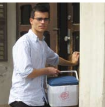
Der Transportcontainer mit Blutstammzellen wird überbracht.