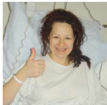
Nach der Spende: Müde, aber glücklich.

Es ist international üblich, die Spender auch in den Jahren nach der Spende in regelmäßigen Zeitabständen über ihr Befinden zu befragen und Blutkontrollen durchzuführen. Daher erfolgt in den Spenderzentren eine regelmäßige Spendernachsorge. Darüber hinaus werden zahlreiche Spender befragt, wie sie die Spende persönlich erlebt haben. Viele dieser Freiwilligen sagen, dass die Spende für sie persönlich sehr wichtig war und dass sie es jederzeit wieder machen würden. Oft haben die Spender den großen Wunsch, von „ihrem“ Patienten Nachrichten über seine Genesung zu hören.