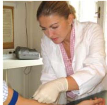
Blutstammzell-Spende: Die Vene wird punktiert.

Wenn ein potentieller Spender/eine potentielle Spenderin als Lebensretter identifiziert ist, wird er noch einmal gefragt, ob er zu spenden bereit ist. Wenn der Spender/die Spenderin einverstanden ist, wird er in einem sehr ausführlichen Informationsgespräch über alle Eventualitäten der Spende aufgeklärt. Eine internistische Untersuchung und eine Blutabnahme stellen sicher, dass der Spender gesund und frei von Infektionskrankheiten ist. Erst nach Überprüfung des aktuellen gesundheitlichen Status des potentiellen Spenders und nach seiner nochmaligen Einverständniserklärung kann das Startzeichen für die tatsächliche Spende gegeben werden.