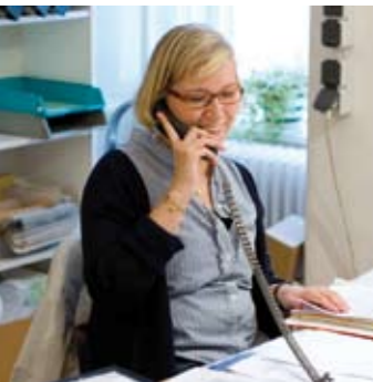
Telekommunikation als notwendige Voraussetzung der internationalen Zusammenarbeit.